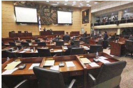
LEGISLATIVO. La Asamblea Nacional es uno de los entes públicos peor evaluados.