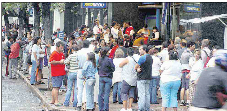
Opinión pública. El Frente Amplio recibe más apoyo electoral entre los sectores beneficiarios de los programas asistenciales.

El estudio de Queirolo fue presentado en agosto en el Tercer Congreso Uruguayo de