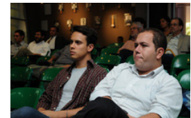
La Encuesta de Opinión Pública de América Latina, se realiza en 26 países distintos, en cada uno de ellos, LAPOP entrevista a más de 1500 personas. Si desea conocer más datos de la encuesta puede visitar la página: http://www.vanderbilt.edu/lapop/ab2012.php