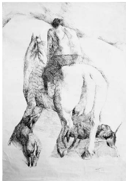
Hombre a caballo y perros

A diferencia del conflicto en sí mismo, las características socioeconómicas sí tienen un peso importante a la hora de determinar la participación en protestas a favor del gobierno nacional. La probabilidad de participar en protestas a favor del gobierno es más del doble para quienes se identifican como "indígenas" en relación a quienes se sienten "mestizos". Al mismo tiempo, los jóvenes participan mucho más en protestas a favor del gobierno que sus mayores, y la probabilidad de que un ciudadano que vive en los departamentos del sur