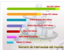
Ascenderán a 750 millones usuarios de Internet en China en 2015