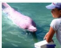
Los delfines rosados del Amazonas amenazados por su uso como cebo