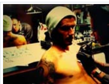
David Beckham sorprende con nuevo tatuaje en Facebook