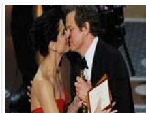
Colin Firth, coronado con el Óscar al mejor actor por "El discurso del rey"