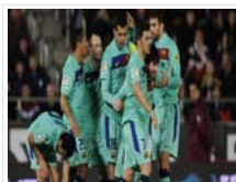
Marca Messi, disfruta el Barça