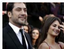
Penélope Cruz y Javier Bardem en la alfombra roja de los Oscar 2011