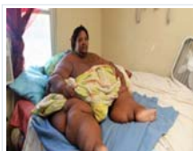
Mujer estadounidense lleva la báscula hasta los 286 kg