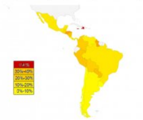
Los países en los que más personas quieren vivir o trabajar