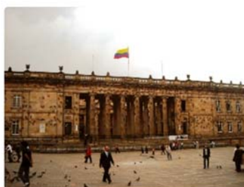
Capitolio Nacional.

Sí bien es cierto que el Congreso ha mostrado incompetencia para sacar adelante proyectos de ley importantes, también es cierto que se aprobaron leyes de gran trascendencia y pertinencia, que llevaron a cambios positivos para un país que empuja a prepararse para el postconflicto.